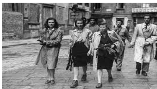
donne in strada

Il 25 Aprile 1945 è la data in cui il "Comitato di Liberazione Nazionale Alta Italia" proclamò l'insurrezione generale contro i nazifascisti che ancora occupavano i territori del nord Italia e assunse il potere "in nome del popolo italiano". Fu il presidente del Consiglio Alcide De Gasperi a proporre la ricorrenza e il 22 aprile 1946 e il Re Umberto II, allora principe e luogotenente del Regno d'Italia, emanò il decreto legislativo e n. 185 che all'articolo 1 recita: "A celebrazione della totale liberazione del territorio italiano, il 25 aprile 1946 è dichiarato festa nazionale".