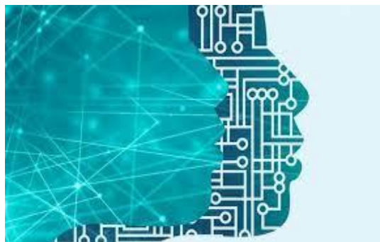
profilo di donna

"DigitALL: innovazione e tecnologia per l'uguaglianza di genere" è stato anche il filo conduttore della giornata dell'8 marzo 2023. Aumentare le competenze digitali rosa e portare sempre più donne verso la tecnologia può difatti aumentare la consapevolezza sui propri diritti civili e può contribuire a garantire una maggiore creatività e innovazione tecnologica per tutti; ed ancora, avvicinare le donne alla tecnologia vuol dire anche "risparmiare": secondo il rapporto Gender Snapshot 2022 di UN Women, l'esclusione delle donne dal mondo digitale ha sottratto 1.000 miliardi di dollari al prodotto interno lordo dei Paesi a basso e medio reddito negli ultimi dieci anni, una perdita che, in assenza di interventi, salirà a 1.500 miliardi di dollari entro il 2025.