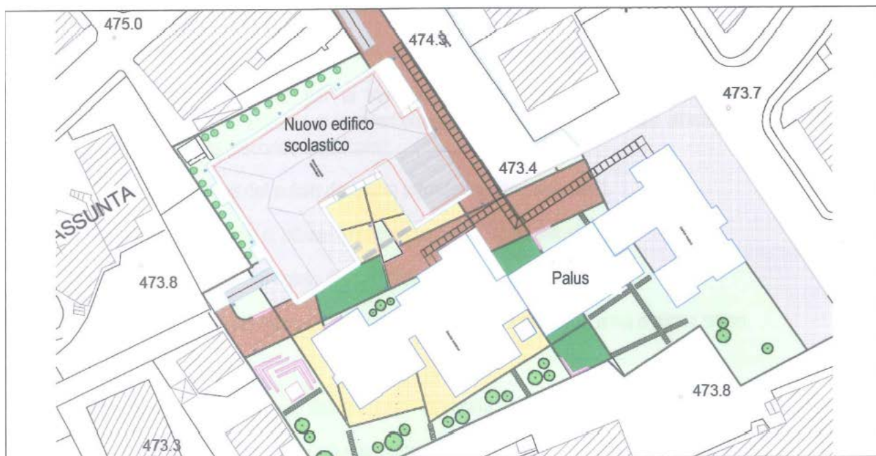
area con l'inserimento del nuovo edificio scolastico

L'intervento, previa demolizione della scuola materna S. Leucio, è così strutturato: