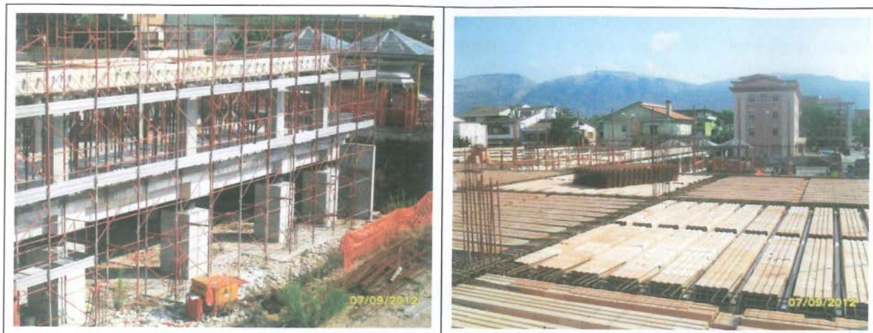
stato attuale del polo scolastico

Nel progetto di primo stralcio si è effettuata la demolizione del fabbricato esistente (Scuola Materna S. Leucio) e la realizzazione della struttura della nuova scuola fatta esclusione della palestra. Le fondazioni dell'edificio scolastico sono su pali con interposti isolatori sismici in modo da rendere la struttura indipendente dalle fondazioni.