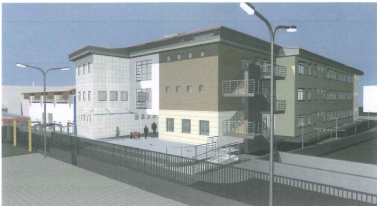
Nuovo edificio scolastico

realizzazione di una scuola elementare, a forma di L, costituita da piano interrato, piano terra, primo piano, secondo piano, che ospiteranno oltre alla palestra anche aule per attività integrative e parascolastiche e la biblioteca.