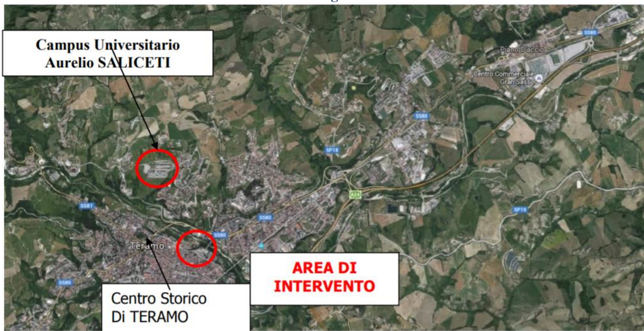
FIGURA 1 – immagine da satellite

L'immobile è situato nel centro storico della Città di Teramo, come da foto seguente.