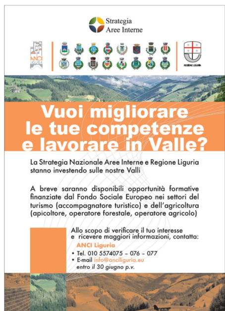
Fig. 1 – La locandina

Per quanto riguarda l'identificazione dei profili professionali da mettere a bando con fondi FSE, ANCI Liguria ha proceduto – su richiesta ed in accordo con il Sindaco Referente - ad un'indagine sul territorio attraverso un questionario online per verificare complessivamente l'interesse della popolazione residente a fruire dell'eventuale opportunità. La fase di rilevazione delle caratteristiche della popolazione residente sul territorio interessata a partecipare alle iniziative formative è stata preceduta dalla produzione di una locandina con la quale si è informata la popolazione circa l'opportunità che verrà attivata. La locandina è stata distribuita ai 16 Comuni dell'Area che hanno provveduto all'affissione, sia nelle tradizionali aree di pubblica affissione sia presso servizi e centri di aggregazione, ed alla pubblicazione sui canali social.