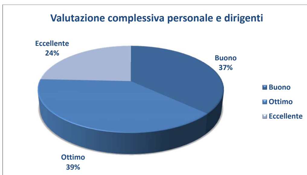
Tavola Personale Agenzia: fasce di valutazione Anno 2016 - Valutazione finale

Nella tavola seguente, è riprodotto un grafico che illustra la distribuzione del personale ACT, dirigente e delle aree funzionali, tra le diverse fasce di merito previste dal sistema di valutazione dell'Agenzia.