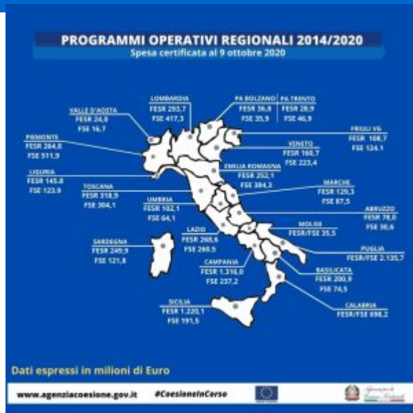
Programmi Operativi Regionali - avanzamento al 9 ottobre 2020