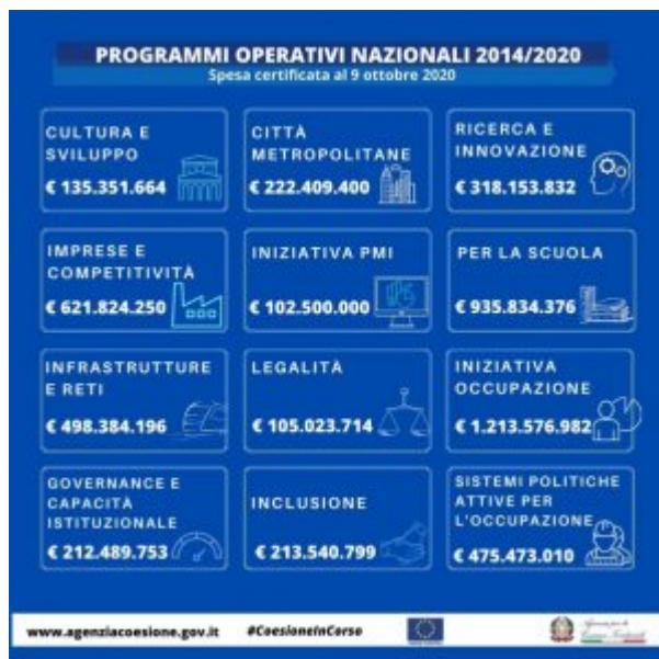
Programmi Operativi Nazionali - avanzamento al 9 ottobre 2020